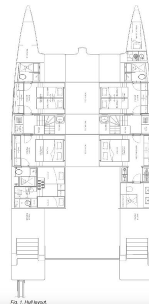
Fig. 1. Hull layout.