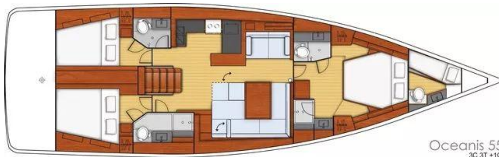
Oceanis 55 3C 3T +1C